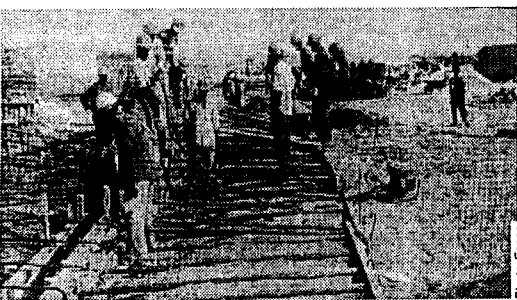
Quand le bâtiment va ...