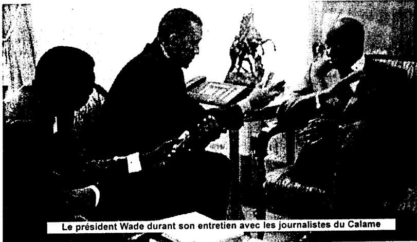
Le président Wade durant son entretien avec les journalistes du Calame

Le Sénégal a une frontière avec la Mauritanie. Il y a des imbrications entre nos peuples. Je suis un chef d'Etat responsable d'abord de la paix dans mon pays et de la paix avec ses