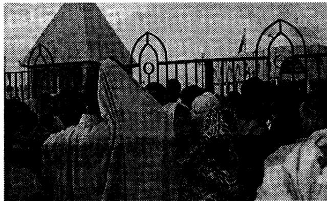
Des militants se bousculant devant la porte du palais