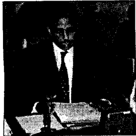
Le ministre des Affaires Economiques et du Développement

tion du premier lot de la route Rosso-Boghé comprenant le tronçon Rosso-Lexaiba en passant par M'Bignick plus la desserte de Teikane pour une longueur de 110 km.