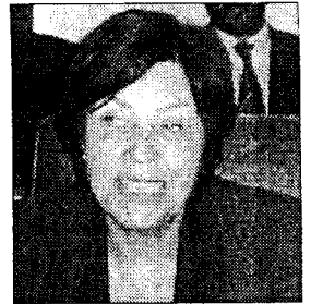
Mme Dominique Pavard, ambassadeur - Chef de Délégation de la CE

Cette démarche s'inscrit dans le cadre des recommandations du plan National des Transports et du Cadre des Dépenses à moyen terme du secteur des infrastructures de transports qui définissent les stratégies et les investissements nécessaires à impulser et soutenir le développement économique et social de notre pays. Le plan de transport et le cadre des dépenses ont été largement approuvés par l'ensemble de nos