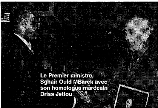
Le Premier ministre, Sghair Ould MBarek avec son homologue marocain Driss Jettou

Assurément, c'est le printemps des relations Mauritano-marocaine. Pourvu que ça dure pour le bonheur et l'intérêt des deux peuples frères.