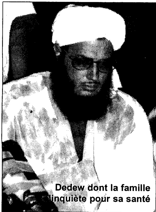
Dedew dont la famille inquiète pour sa santé