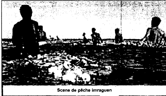
Scene de pêche imraguen