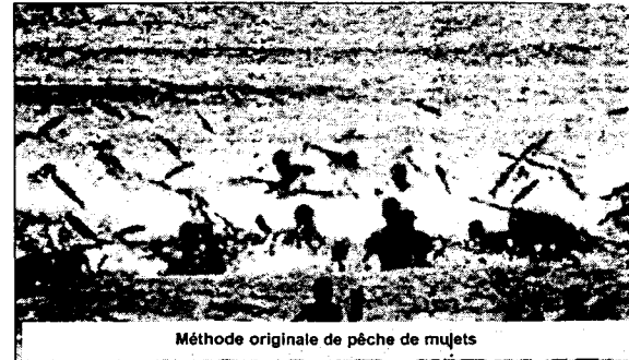
Méthode originale de pêche de mullets