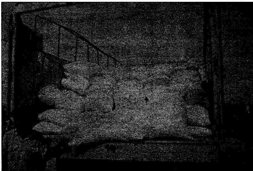
Opération de distribution de vivres

Pour la circonstance, le Commissaire à la Sécurité Alimentaire a précisé que le choix des localités bénéficiaires s'est fait sur la base d'enquêtes effectuées par l'Observatoire de Sécurité