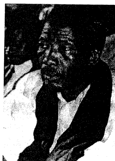
Messaoud Ould Boukheir

compter sur des relais au soutien inconditionnel que sont les chefferies traditionnelles et les hommes d'affaires. Pour commencer, il est indispensable que l'opposition s'entende sur un minimum et qu'elle se réorganise sur de nouvelles bases, sur de nouveaux principes mêmes. Depuis l'éclatement de l'Ufd/en, toutes les tentatives d'unifier l'action des partis d'opposition se sont soldées par des échecs simplement parce que les différents protagonistes mettent en avant des intérêts personnels et partisans au détriment de la construction d'une opposition forte et crédible. Résultat, au lieu de se consacrer à l'essentiel, les formations de l'opposition passent leur temps à se tirer dessus, chacune revendiquant le label de "principal parti d'opposition".