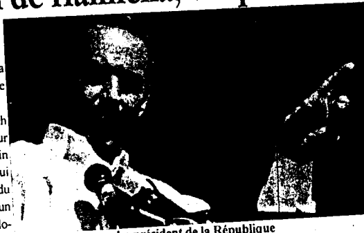
Le président de la République

Menacé de l'extérieur, notamment par les "Cavaliers du Changement" et l'opposition radicale mauritanienne résidant à l'étrange s'alliant à une opposition interne certes fébrile mais jouissant d'une assise populaire certaine, le pouvoir disposait d'une carte d'importance. Il s'agit de la clé de l'apaisement de la scène politique. Nombreux étaient ceux qui voyaient le salut national dans cette perspective... Les acteurs politiques, se retrouvant à l'intérieur du pays, autour de l'essentiel, la scène ne pouvait que s'en ressentir. Et c'est en cela que le spectre de Hannena pouvait servir... Aujourd'hui que l'homme de terrain des "Cavaliers du Changement" est neutralisé, la scène politique n'en demeure pas moins chaotique. Pour preuve, cette rencontre ratée entre le pouvoir représenté par son omnipotent ministère de l'Intérieur et les responsables de l'opposition, qui avaient pourtant eu le courage de casser la glace et de répondre à une invitation, sans forme, de ce ministère. L'objectif étant de voir les armes de la déstabilisation tant