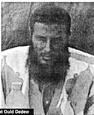
Ould Haïdalla et Ould Dedew