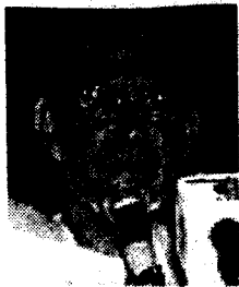
Ahmed Daddah, au meilleur de sa forme politique

Mauritanie. Et nous de notre côté, en tant que parti d'opposition, nous avons toujours suivi avec acuité ces données et il est apparu à la longue que ces rapports n'avaient rien à voir avec la réalité sur le terrain. Si nous considérons par exemple la parité entre l'ouguiya et le Franc CFA ou l'Euro, nous constatons qu'en vingt