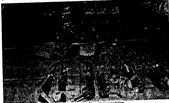
Vue d'une partie des armes saisies