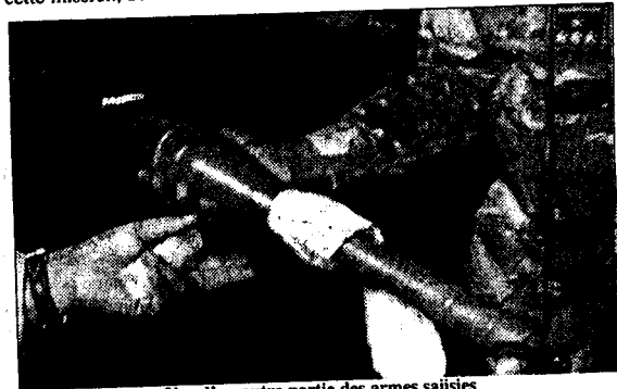
Vue d'un autre partie des armes saisies