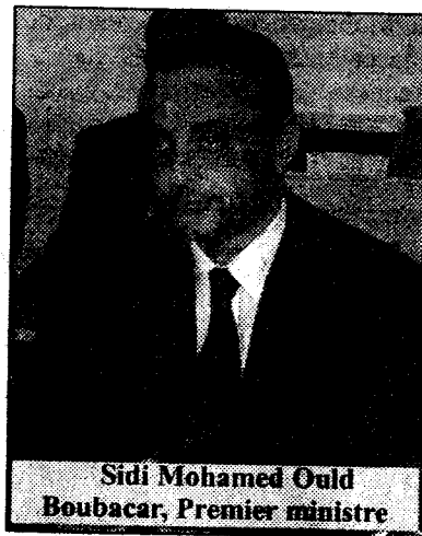
Sidi Mohamed Ould Boubacar, Premier ministre

pour la Justice et la Démocratie et le gouvernement s'engagent à ne soutenir aucun candidat et à ne créer ni appuyer aucun parti au cours de la période transitoire.